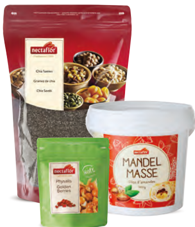
Chia Samen / Soft Physalis / Mandelmasse

Der fixfertige vegane Aufstrich kann direkt aus dem praktischen Eimer verwendet und daraus feinste Saucen oder Speisen kreiert werden. Auf dem Frühstücksbuffet kann er als kreativer Brotaufstrich punkten. Sorgfältig ausgewählte und in der Schweiz verarbeitete Rohstoffe verleihen diesem veganen Aufstrich einen wunderbaren, köstlichen und unverwechselbaren Geschmack.