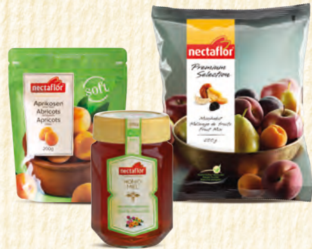
Aprikosen süß / Bio Blütenhonig flüssig / Mischobst Abricots doux / Bio Miel de fleurs liquide / Mélange de fruits