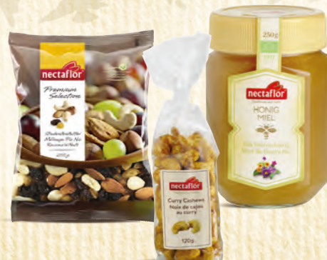
Studentenfutter / Curry Cashews / Bio Blütenhonig kristallin Mélange Pic Nic / Noix de cajou au curry / Bio Miel de fleurs cristallisé