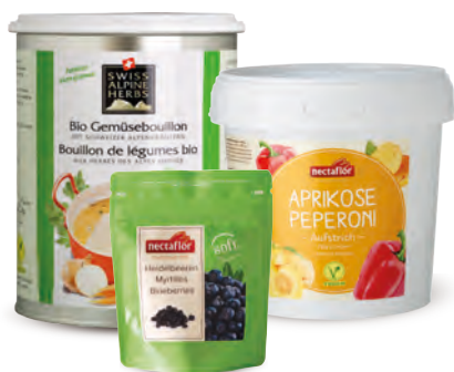
Bio Bouillon de légumes / Soft Myrille / Pâte à tartiner Abricot-Poivron

La pâte à tartiner vegane toute prête peut être directement employée à partir de son emballage pratique afin de créer de savoureuses sauces ou des mets délicieux. Sur le buffet du petit-déjeuner, sa créativité fera merveille. Les matières premières qui composent cette pâte à tartiner vegane ont été soigneusement sélectionnées et travaillées en Suisse, elles lui donnent un goût exceptionnel, savoureux et incomparable.