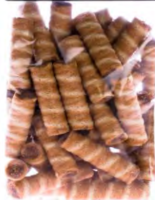
Swiss 100g / 200g