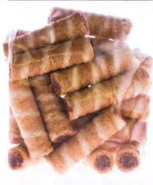
Edel 100g / 200g