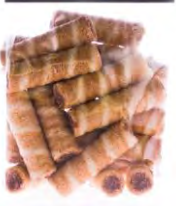
Edel 100g / 200g