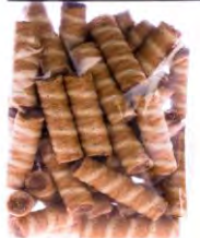
Swiss 100g / 200g