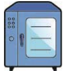
Combi-steamer / Four